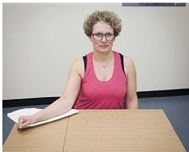
Billede 3 - til max. udadrotation