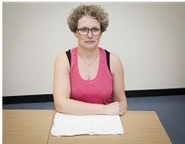
Billede 1 - udgangsstilling

Hvis du ikke må lave aktive øvelser, bruges den raske hånd til at føre underarmen væk fra kroppen.