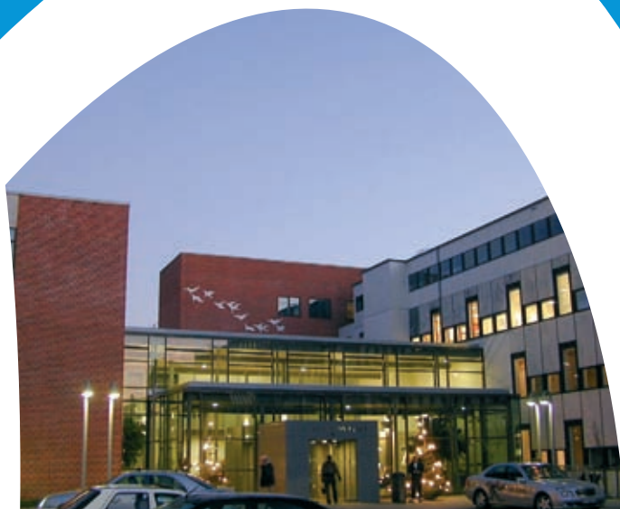
Sydvestjysk Sygehus Esbjerg